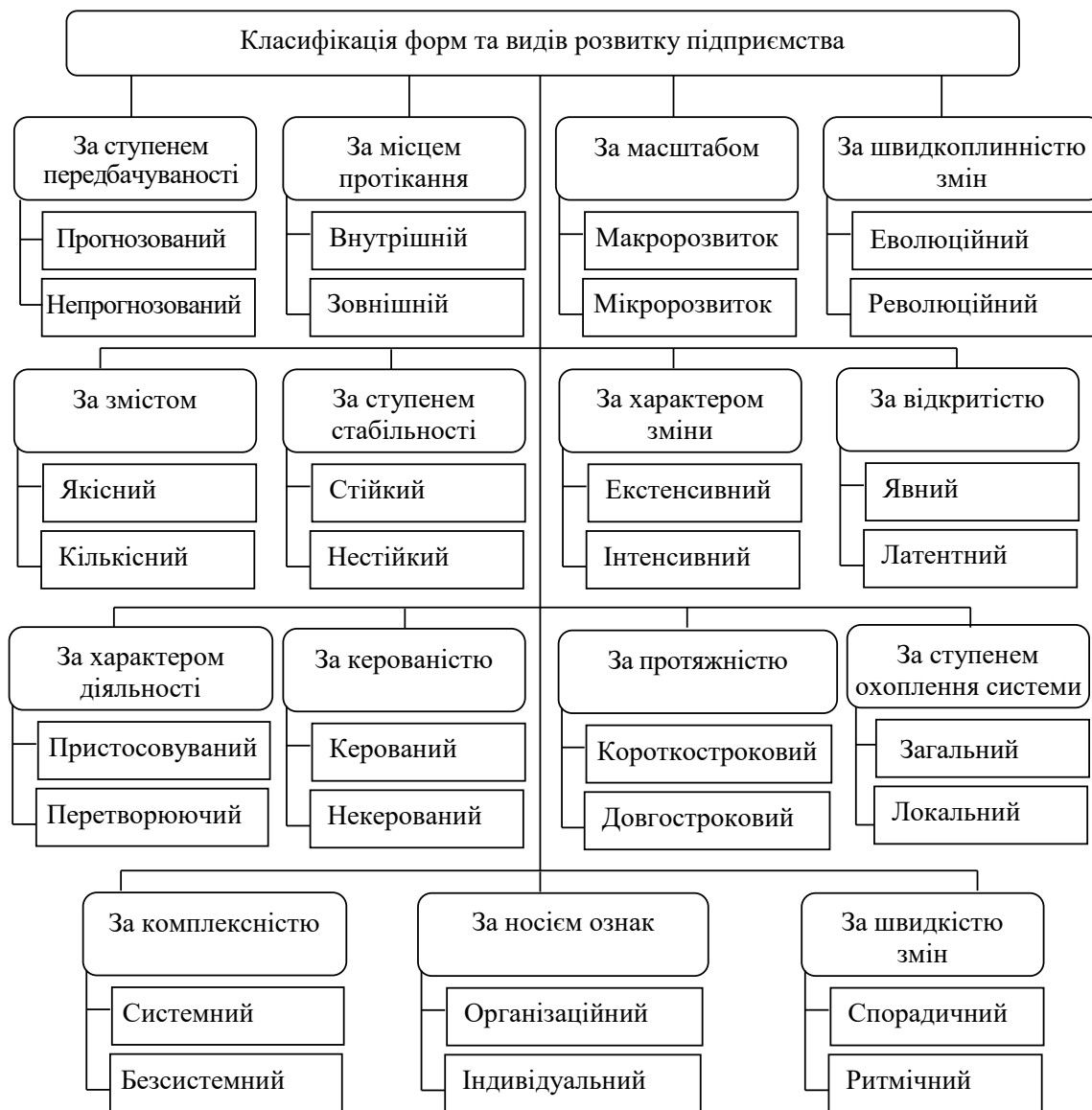
Рис. 1. Класифікація форм та видів розвитку підприємства