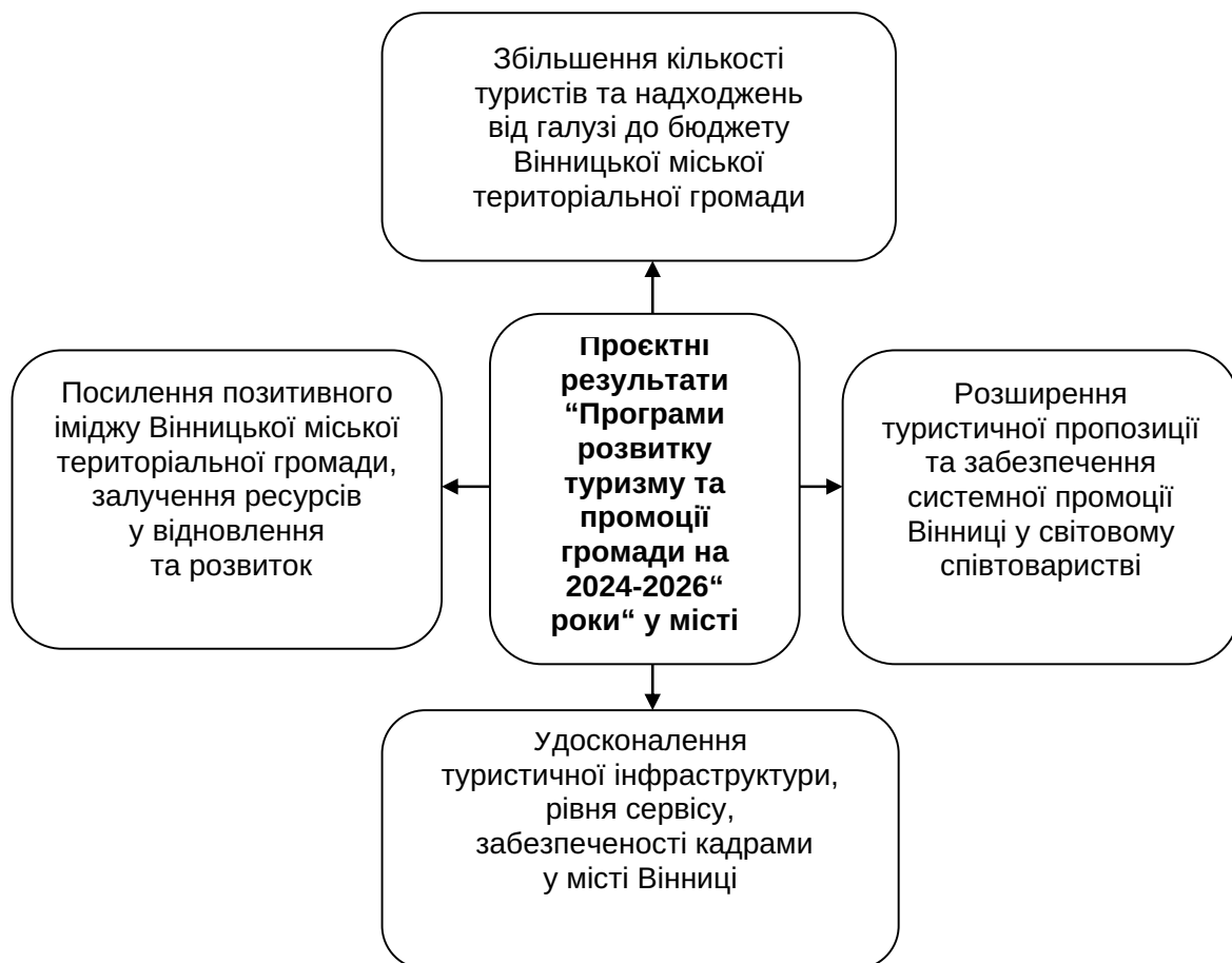
Рис. 2. Проектні результати “Програми розвитку туризму та промоції громади на 2024–2026 роки” у місті Вінниці

Проаналізовано життєвий шлях особистей, які продовжили закони та настанови “Пласту” – Національної скаутської організації України під час російсько-української війни та подвиг Героїв, які віддали життя за свободу та Незалежність України, а саме: Степан