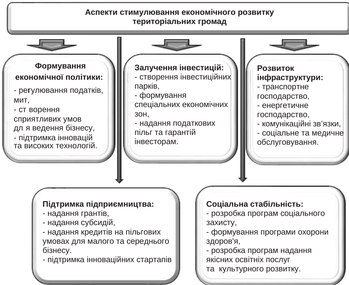
Рис. 1. Аспекти стимулювання економічного розвитку територіальних громад