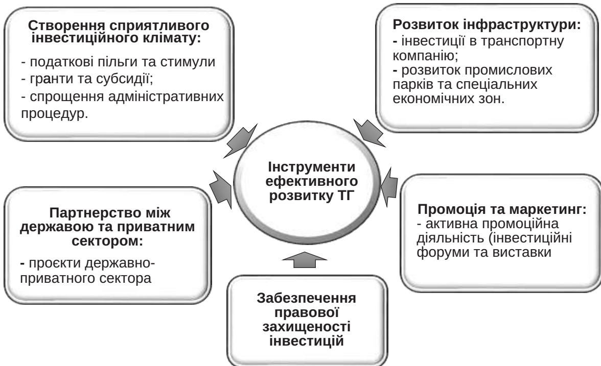
Рис. 3. Основні інструменти, що забезпечують ефективний розвиток територіальних громад

Отже, для забезпечення ефективного розвитку важливими аспектами на даний час є: