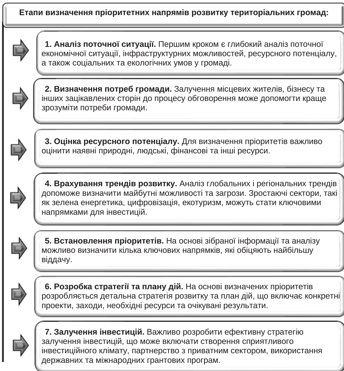
Рис. 2. Етапи визначення пріоритетних напрямів економічного розвитку територіальних громад

– Сіліконова долина в Каліфорнії є світовим центром технологічних інновацій, де зосереджені головні офіси багатьох лідерів у галузі високих технологій. Ключ до успіху полягає у взаємодії між вищими навчальними закладами (наприклад, Стенфордським університетом), дослідницькими інститутами,