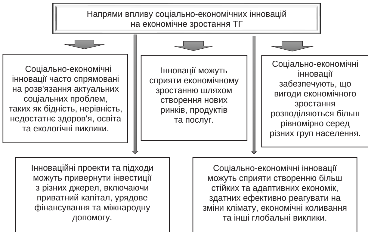
Рис. 5. Напрями впливу соціально-економічних інновацій на ефективність розвитку територіальних громад

Висновки. Дослідження концепції економічного розвитку територіальних громад виявило глибоке розуміння того, як різноманітні фактори взаємодіють для стимулювання росту та розвитку на місцевому рівні. Важливість інтегрованого підходу, який включає стратегічне планування, участь громади, інвестиції в соціальну інфраструктуру, підтримку малого та середнього бізнесу, а також інновації, є очевидною. Отже, важливим є застосування саме комплексного підходу до економічного розвитку територіальних громад, який враховує специфічні потреби та можливості кожної громади. Співпраця уряду, приватного сектору, неприбуткових організацій та місцевих громад є ключовим фактором успіху у цьому процесі.