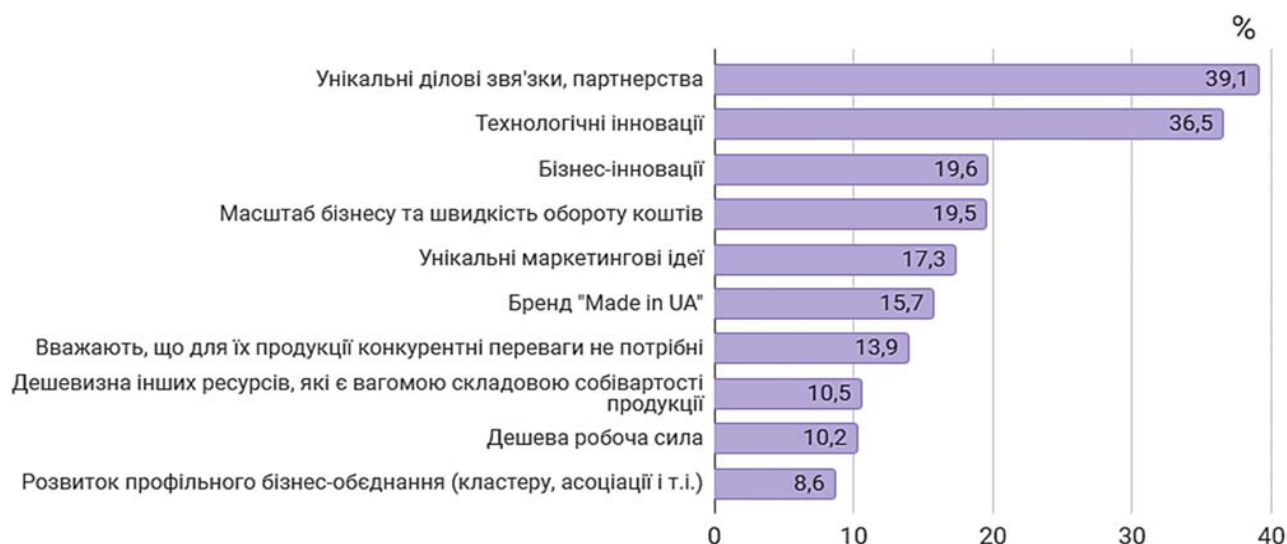
Рис. 2. Застосування реальних інструментів адаптації бізнесу