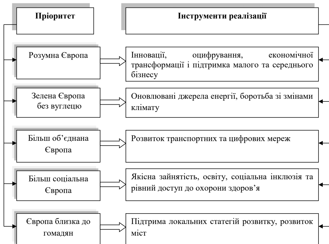
Рис. 1. Інвестиційні пріоритети політики згуртування ЄС на 2021–2027 рр.