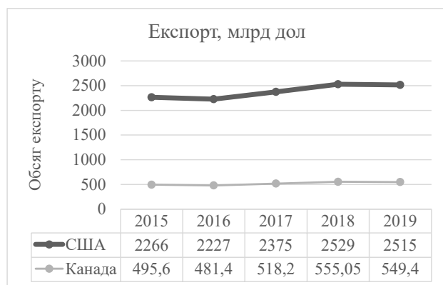
Рис. 1. Грошовий еквівалент експорту США та Канади, млн дол.