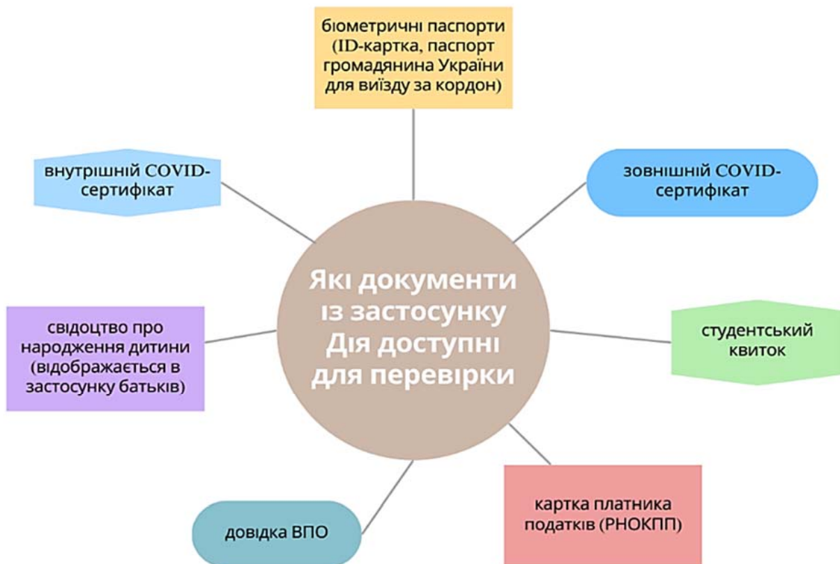
Рис. 2. Спектр документів доступних у застосунку «Дія»

Покращення використання інформаційно-комунікаційних технологій у процесі взаємодії влади та суспільства вже давно перестало обмежуватися державними та міс-