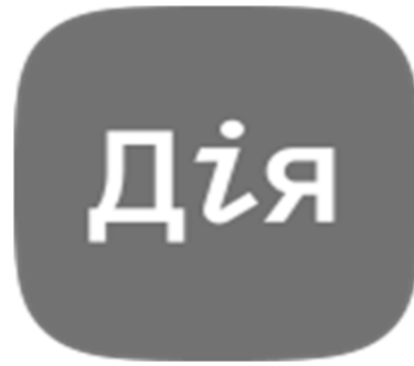
Рис. 1. Логотип додатку «Дія» [2]

Станом на 2022 рік додатком та порталом вже користуються понад 1700 мільйонів людей. На порталі доступно понад 72 позиції