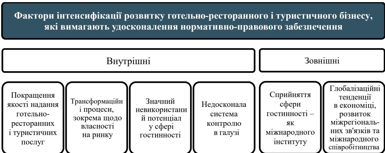
Рис. 1. Факторний аналіз необхідності удосконалення нормативно-правового забезпечення готельно-ресторанного і туристичного бізнесу

Серед Законів України, що забезпечують регулювання основних аспектів господарської діяльності підприємств готельно-ресто-