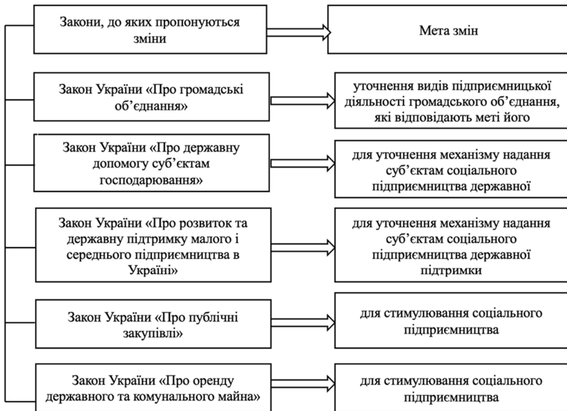
Рис. 1. Закони, зміни яких покращать правовий стан СП