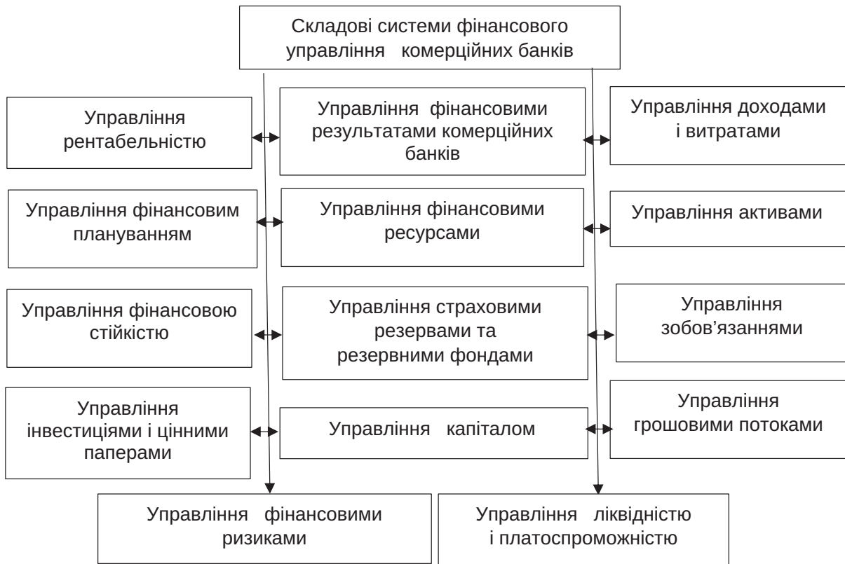
Рис. 2. Складові системи фінансового управління комерційних банків