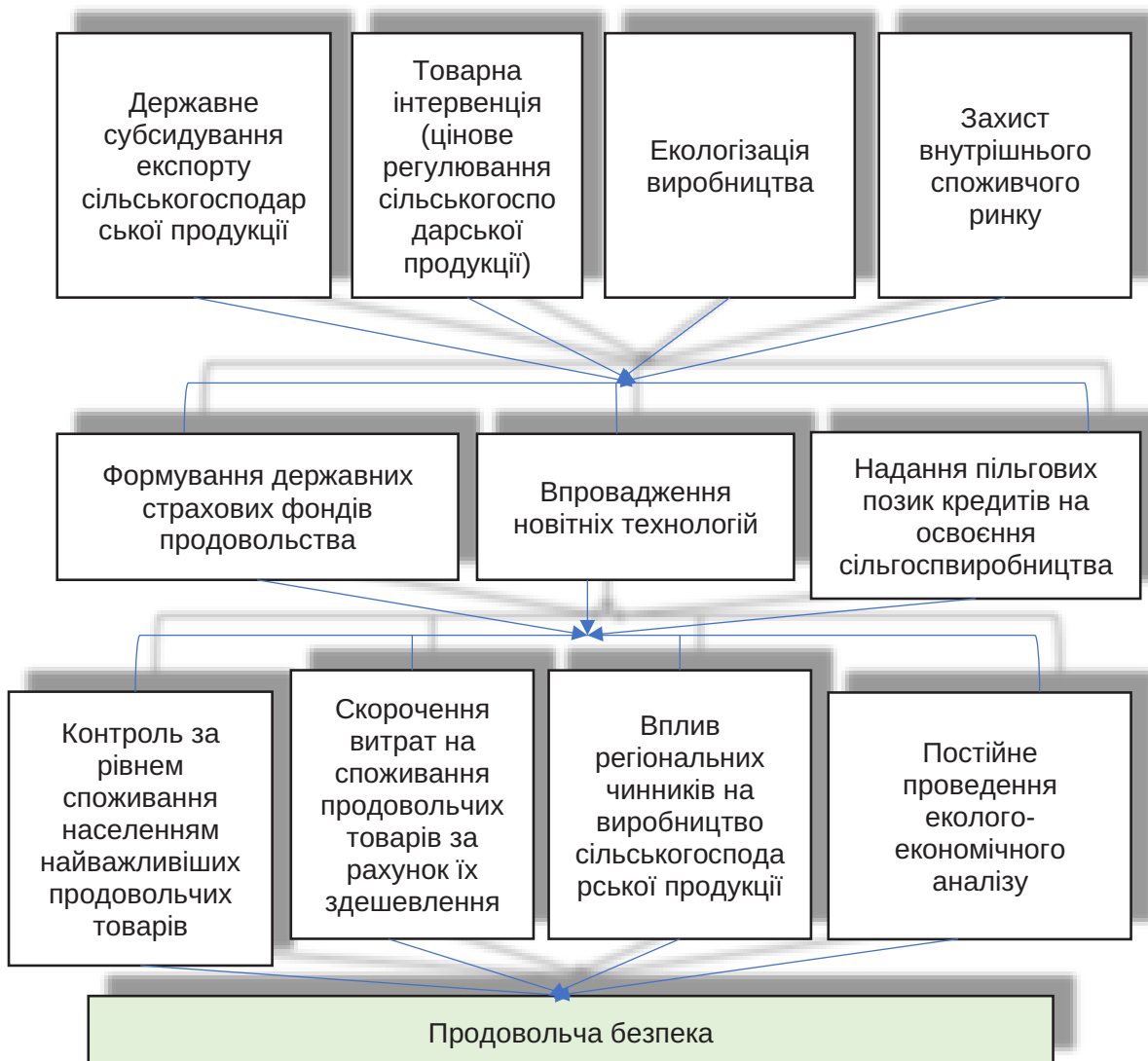
Рис. 2. Основні орієнтири, що забезпечують продовольчу безпеку

– стійке використання природних ресурсів, де збереження та раціональне використання земель, водних ресурсів та інших