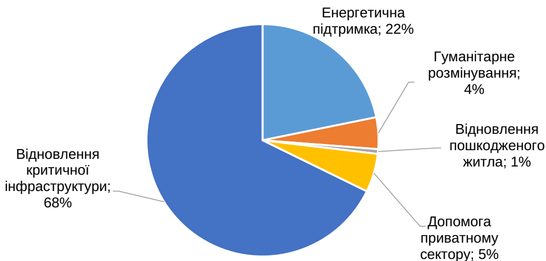
Рис. 3. Структура розподілу міжнародного фінансування, залученого на потреби швидкого відновлення України (станом на 13.07.2023 р.), %

Керівництво Світового Банку та співробітники Бюро економічної безпеки (БЕБ) України у березні 2023 р. започаткували постійну робочу комунікацію з розслідування справ, пов'язаних із фактами шахрайства та зловживань у використанні міжнародної технічної допомоги (МТД), що надається в рамках проектів за фінансування Світового Банку. Також БЕБ обмінюватиметься та щоденно взаємодітиме з USAID [31]. З жовтня 2023 р., спільно з компанією Делойт Консалтинг, яка реалізує проект USAID SOERA, Мінфін здійснює моніторинг використання прямої бюджетної підтримки Уряду США, а з аудиторською компанією PriceWaterhouseCoopers Ukraine – перевірку за узгодженими процедурами з метою визначення допустимих дер-