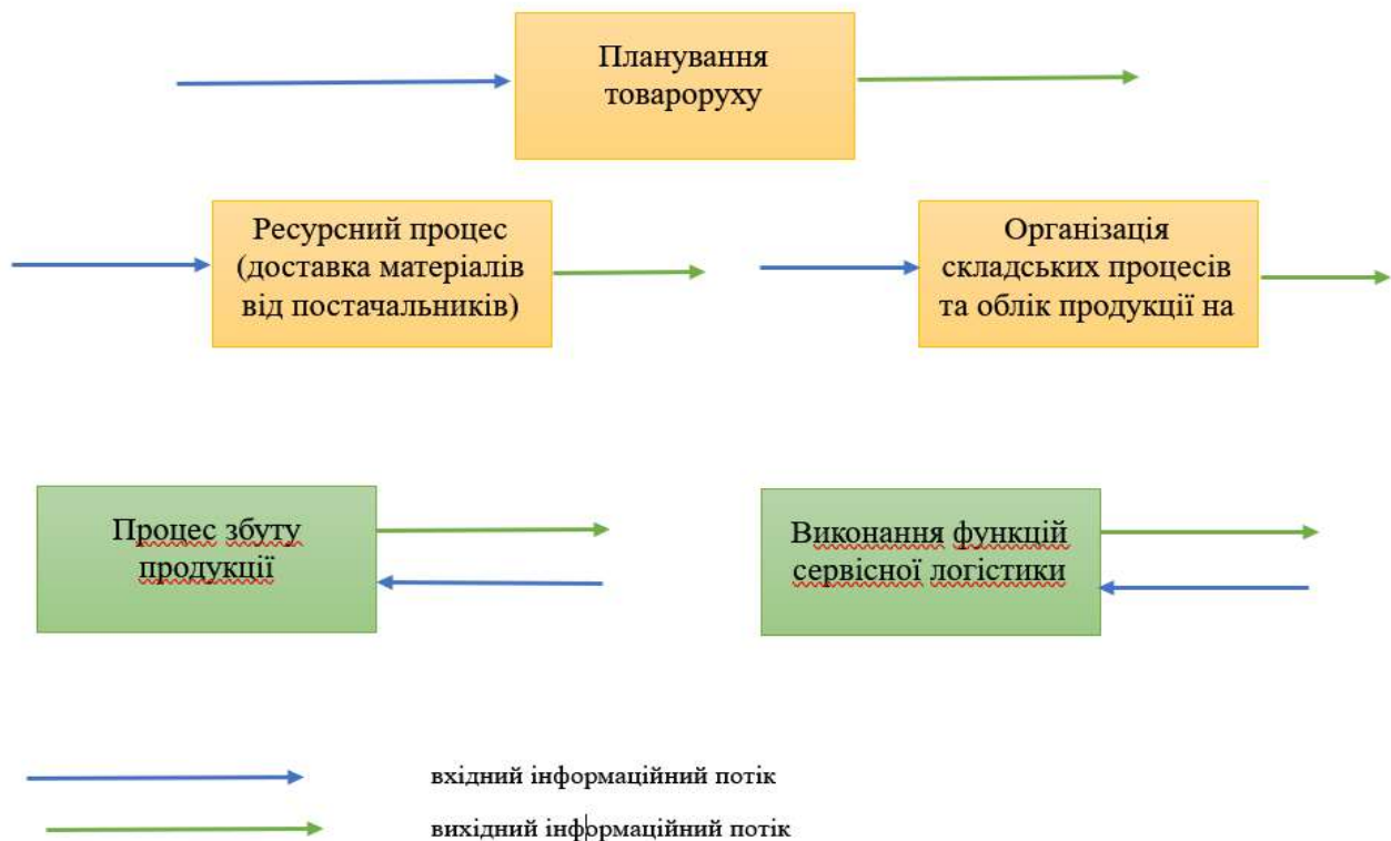
Рис. 3. Напрями руху інформаційних потоків бізнес-процесів на підприємствах оптової торгівлі