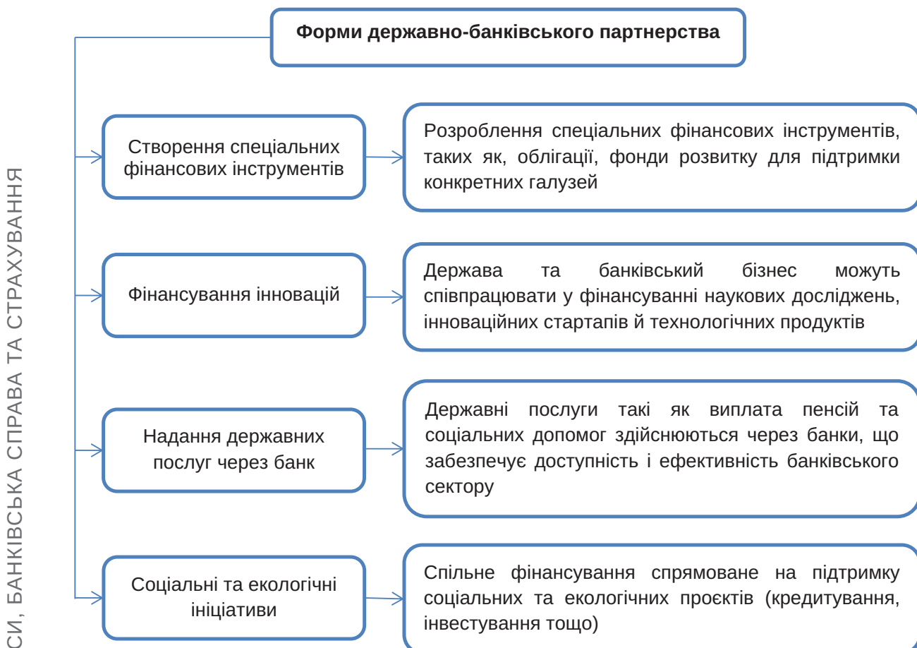
Рис. 2. Форми здійснення державно-банківського партнерства в Україні.

У сфері інституційних перетворень економіки державно-банківське партнерство перебуває на етапі розвитку і як форма організації проєктного фінансування передбачає низку переваг як для держави, так й банківського бізнесу, основні з них наведено у табл. 1.