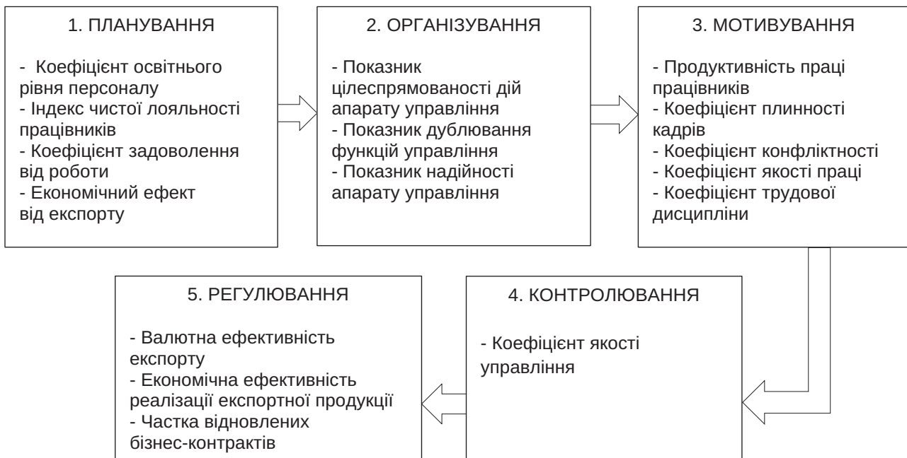
Рис. 3. Рекомендована система індикаторів здійснення функціональної діагностики зовнішньоекономічної діяльності за управлінськими процесами