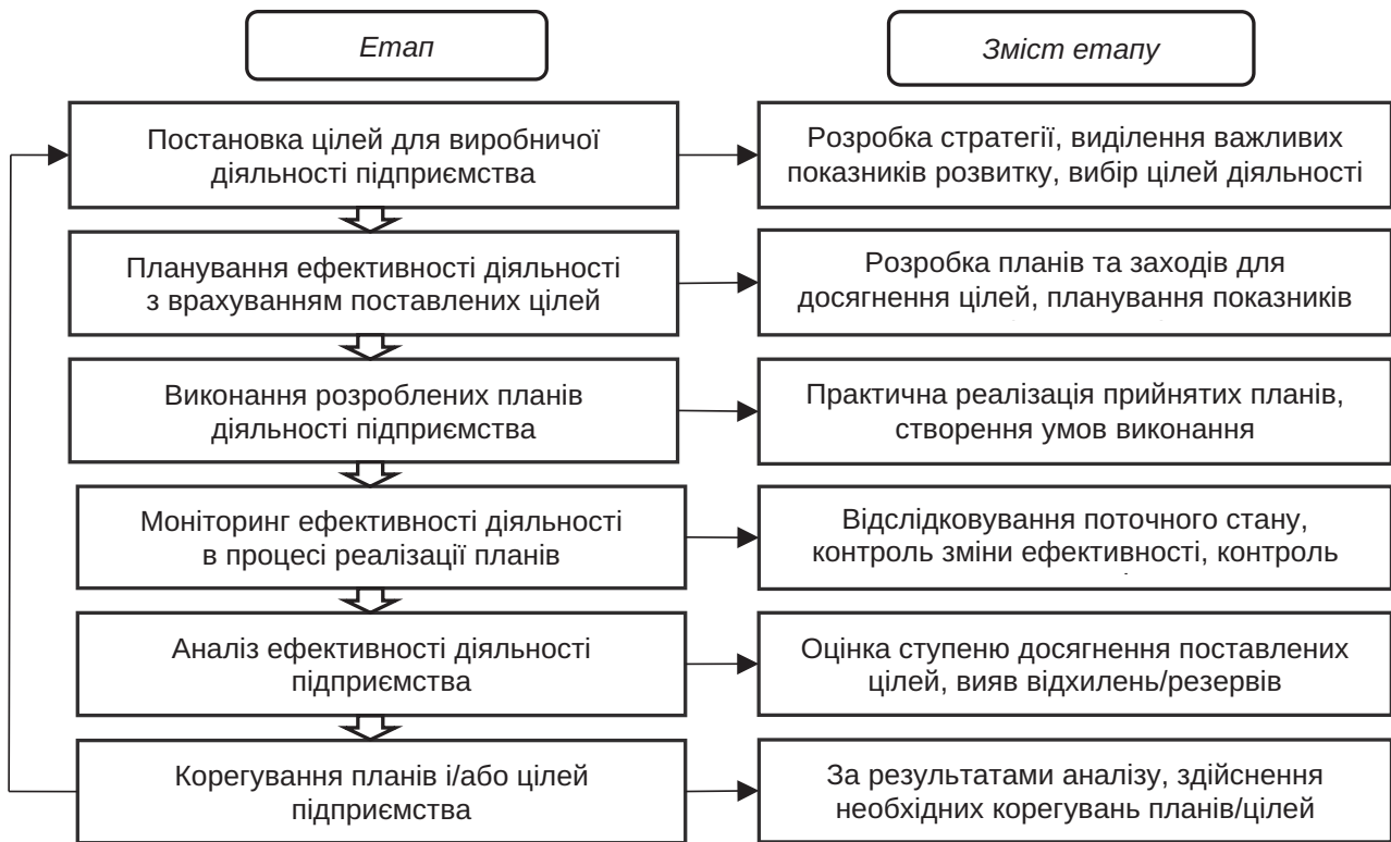
Рис. 1. Етапи процесу управління ефективністю виробничої діяльності підприємства