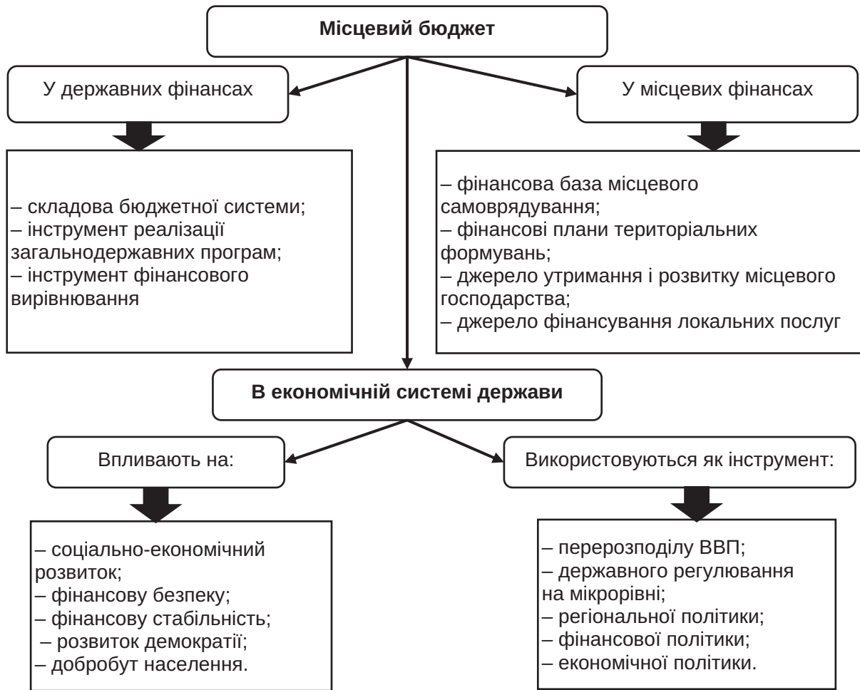
Рис. 2. Суспільна роль місцевих бюджетів