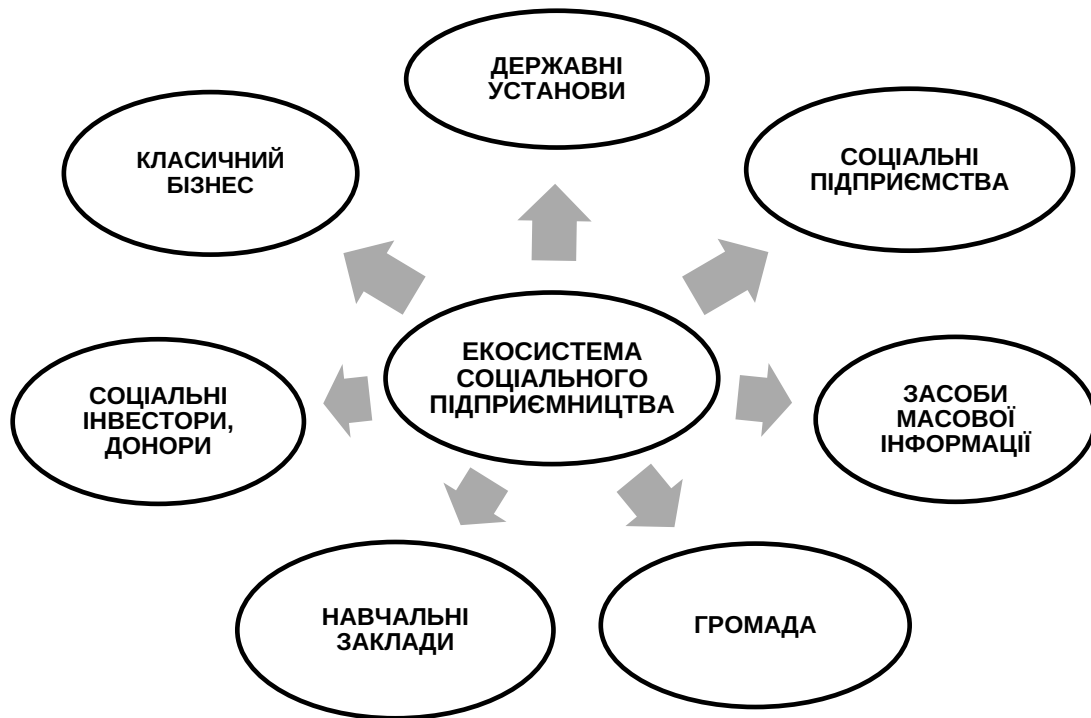
Рис. 2. Екосистема соціального підприємництва України