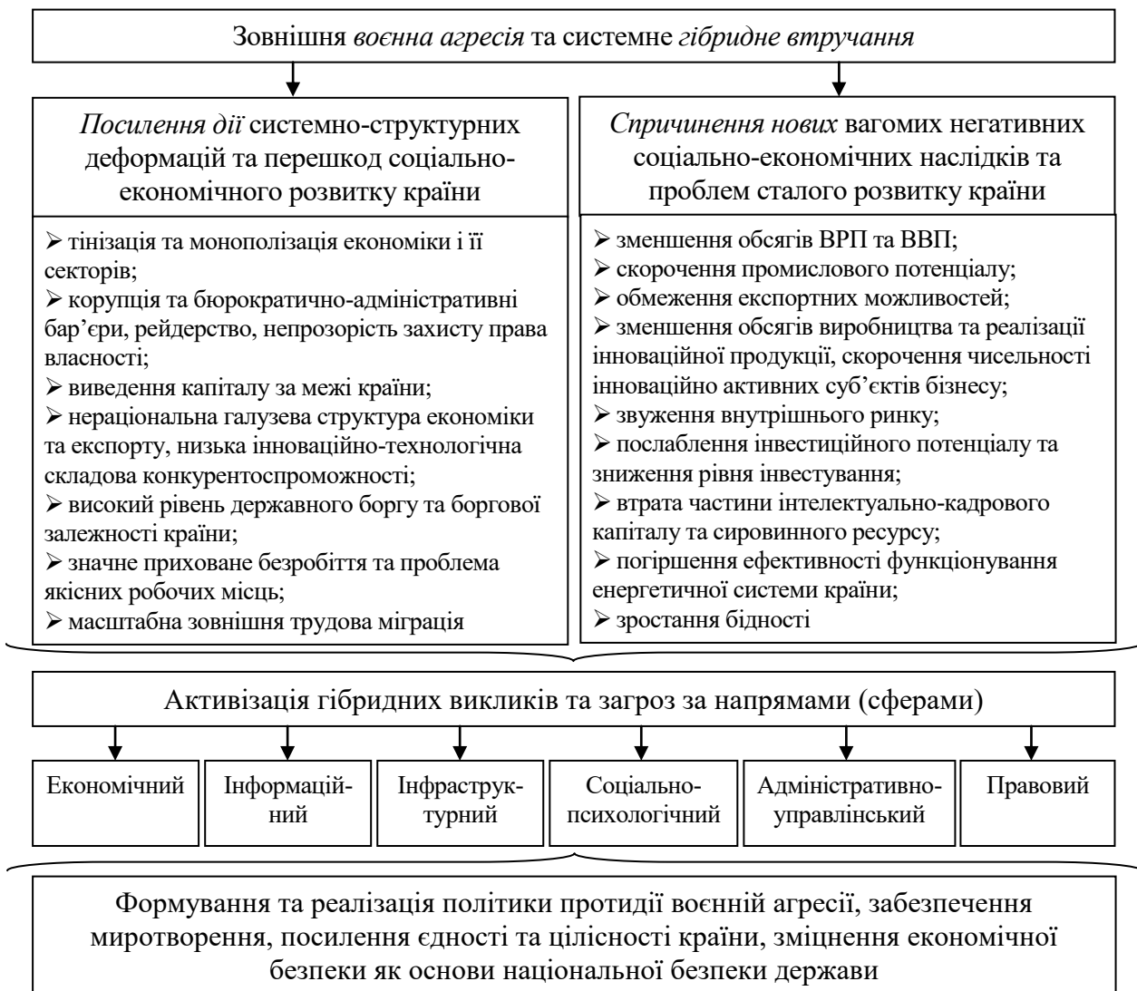
Рис. 3. Сучасні макроекономічні та соціальні передумови, напрями активізації гібридних загроз миробудівництва і забезпечення економічної безпеки України

Обґрунтування якісних пропозицій з формування та реалізації політики миротворення в Україні об'єктивно потребує відповідного інформаційно-аналітичного забезпечення в частині аналізування стану економічної без-