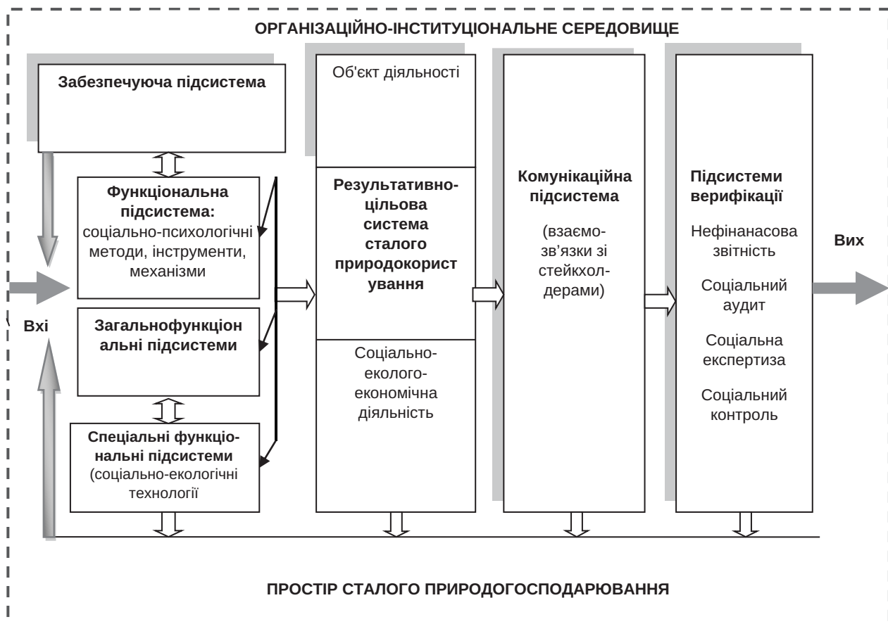
Рис. 1. Структурно-функціональна схема комплексного некомерційного механізму сприяння сталому розвитку просторового природогосподарювання

Соціально-екологічні технології, пов'язані, зокрема, і з функціонуванням механізмів соціально-екологічної відповідальності та екологічним менеджментом і передбачають застосування таких основних екологічно спрямованих соціальних інструментів як: аудит, експертиза, контроль та контролінг,