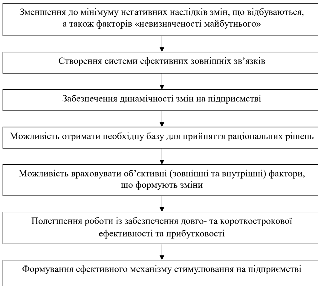
Рис. 3. Основні переваги, які отримує підприємство в результаті застосування стратегічного управління

Резюмуючи зазначимо, що стратегічне управління – це реалізація концепції, яка поєднує цілеспрямовані та інтегровані підходи до функціонування підприємства, що дозволяє встановлювати цілі розвитку, співставляти їх з існуючими можливостями підприємства та привести їх у відповідність до розробки та впровадження стратегії. Основою стратегічного управління є стратегічний набір підприємства, який забезпечує комплекс бізнес, організаційних та соціальних напрямків. Основним завданням стратегічного управління є визна-