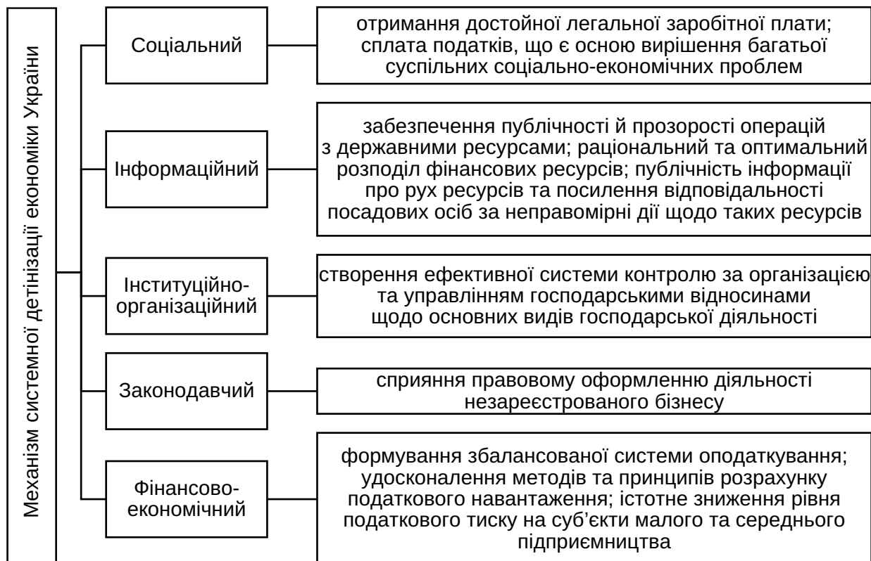
Рис. 3. Механізм системної детінізації економіки України