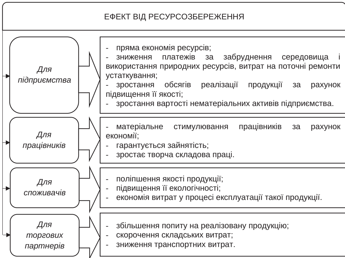
Рис. 3. Ефект від ресурсозбереження для суб'єктів-господарювання