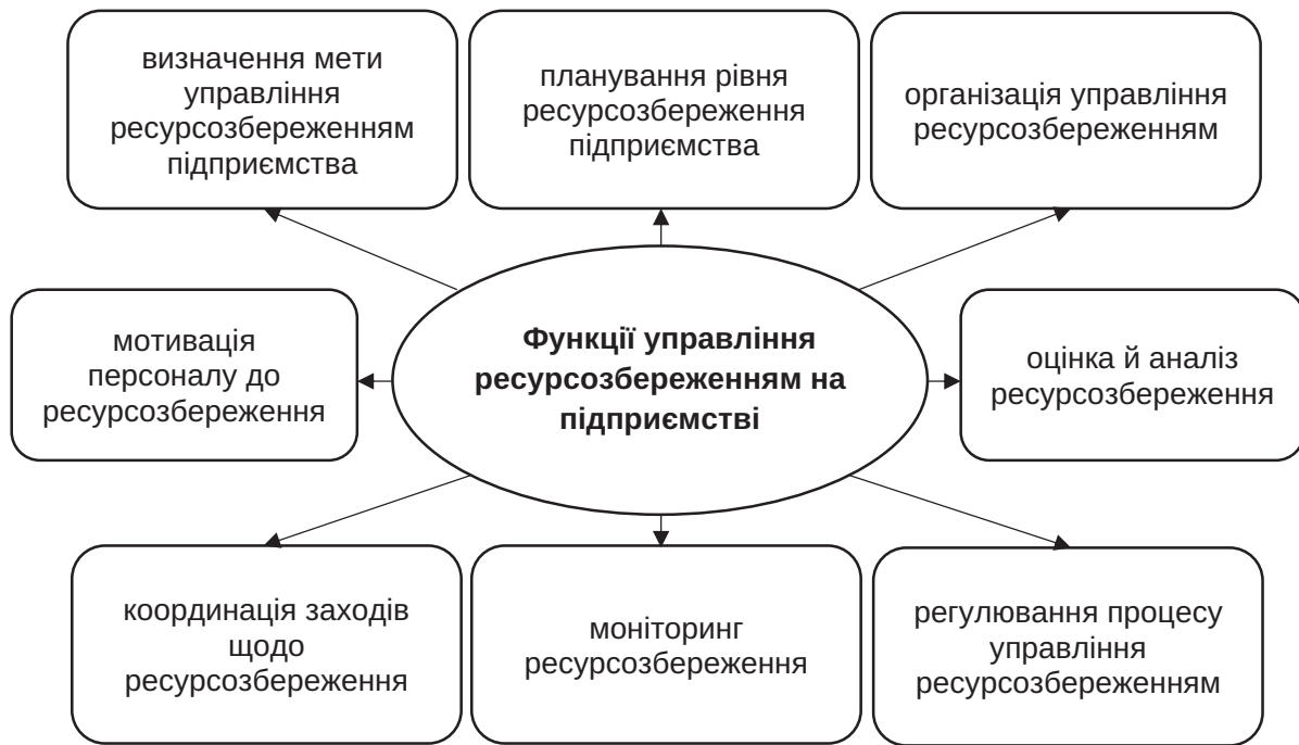
Рис. 2. Функції управління ресурсозбереженням на підприємстві