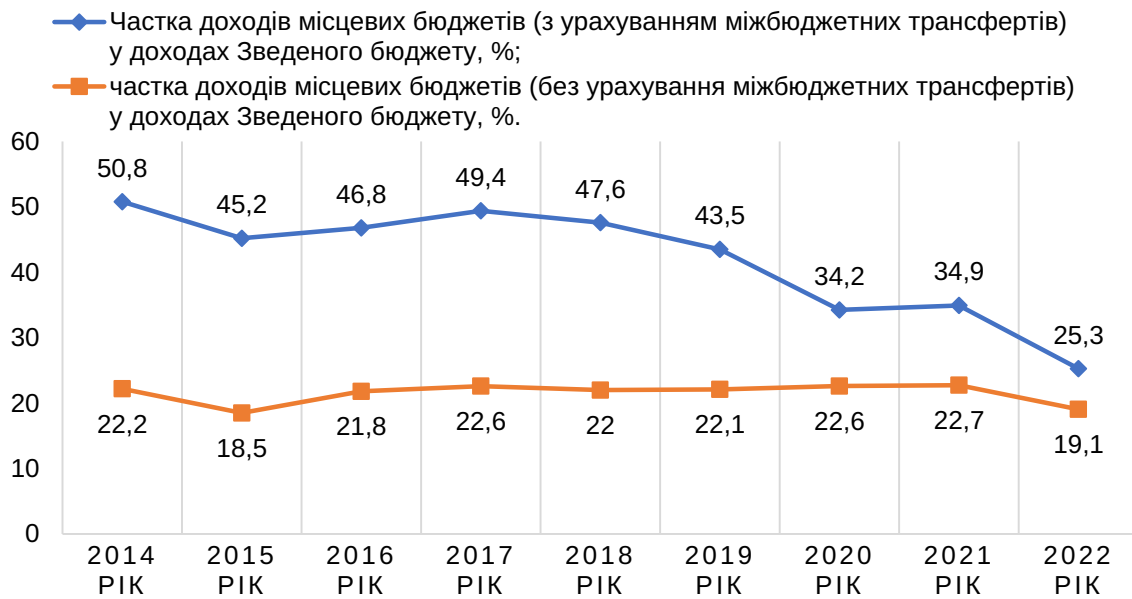
Рис. 2. Рівень фінансової самостійності місцевих бюджетів, %