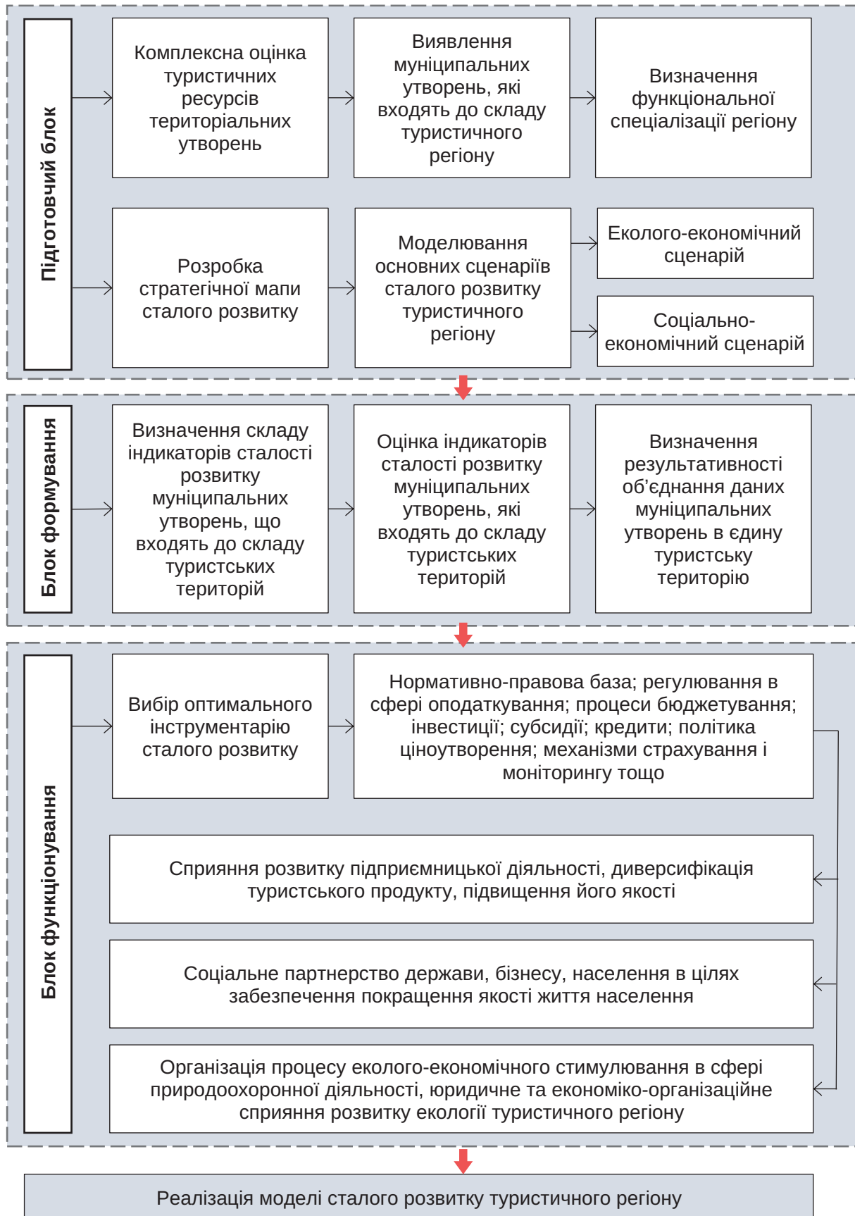
Рис. 3. Функціонально-логічна модель стратегічного управління розвитком туристичного регіону на засадах сталого розвитку