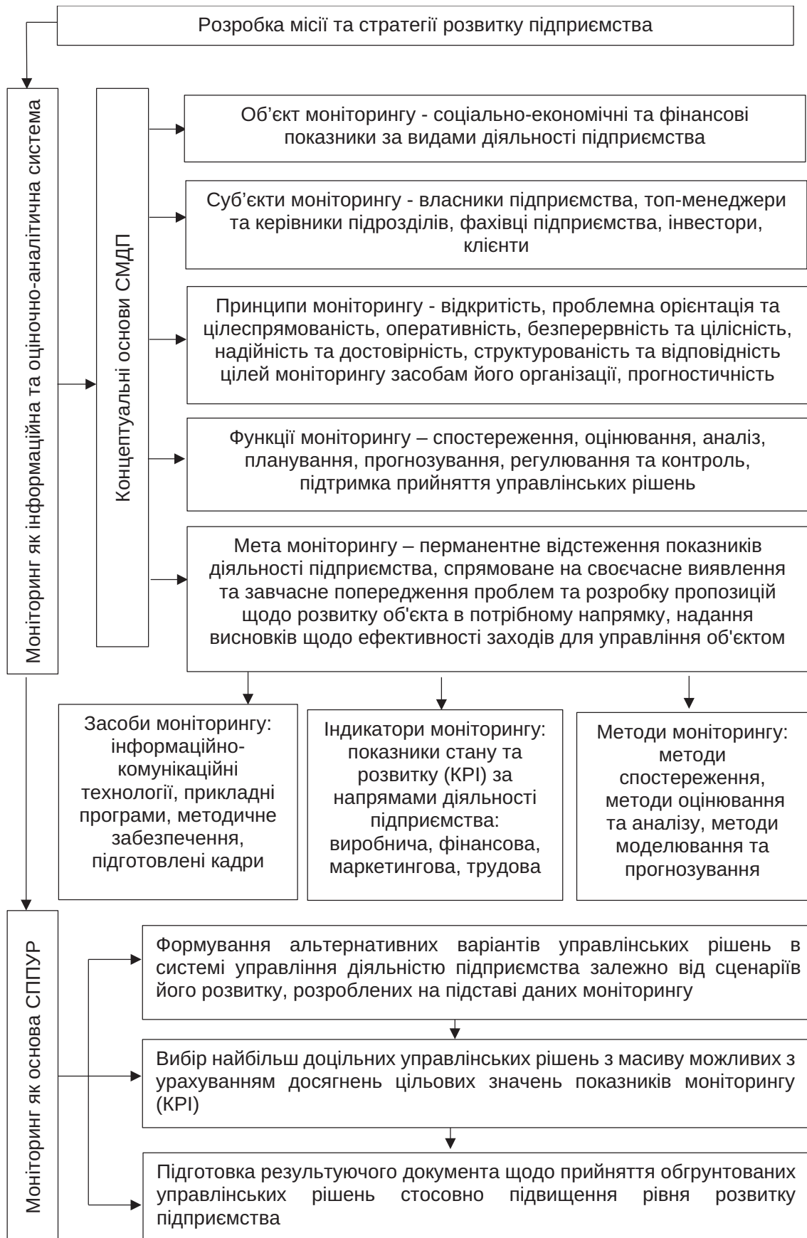
Рис. 2. Концептуальна модель моніторингу діяльності підприємства як основи інформаційно-діагностичної та управлінської систем