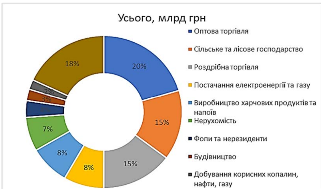
Рис. 2. Розподіл кредитів за видами економічної діяльності за 2022 рік

Банки та кредитори виявляють бажання підтримувати сільськогосподарський сектор, але необхідно щоб у фермерів і виробників була мотивація та стимул щодо інвестування та кредитування. Також важливо впровадити реформи, спрямовані на конвертацію