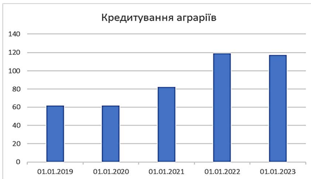
Рис. 3. Динаміка кредитування аграрних підприємств