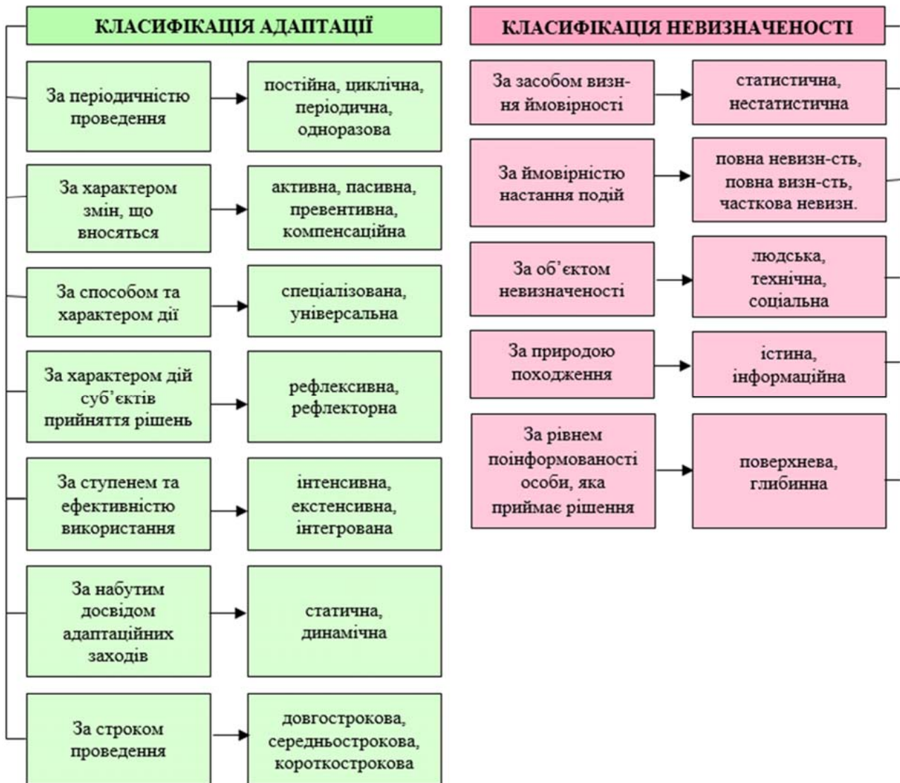
Рис. 2. Видові класифікації адаптації та невизначеності

лась на незначних змінах, частковій невизначеності та упорядкуванні внутрішнього стану системи відповідно до зовнішніх впливів. Цей період відповідає етапу SPOD світу і характеризується помірністю. Наступні два періоди характеризуються більшою динамічністю, яка властива VUCA світу і визначення адаптації представляється як процес перебудови, тобто більш кардинальних дій над системою відповідно до екзогенних впливів. І, нарешті, сучасний етап, який відповідає турбулентному VANI світу, визначає адаптацію як науково-обґрунтовану програму дій, оскільки адаптація стає надскладною та багатоваріантною. Отже, поняття адаптації – досить широке і діалектично пов'язано з багатьма соціально-економічними сферами і, саме тому, воно має досить диференційоване значення.