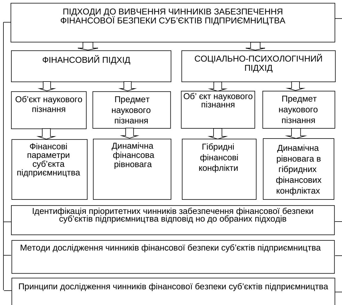
Рис. 1. Структурно-логічна схема використання наукових підходів до вивчення чинників забезпечення фінансової безпеки суб'єктів підприємництва

ФІНАНСИ, БАНКІВСЬКА СПРАВА ТА СТРАХУВАННЯ