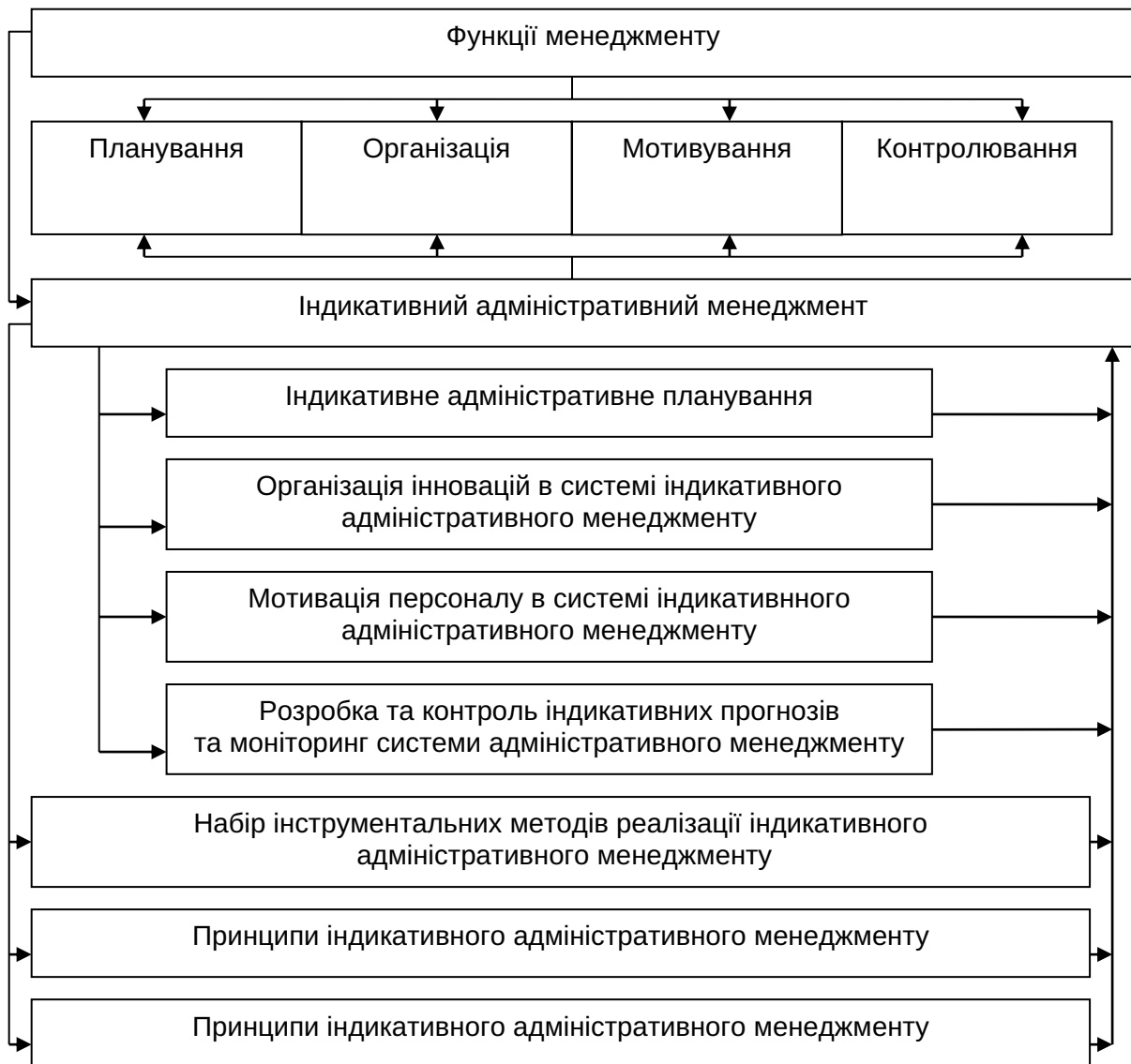
Рис. 1. Складові індикативних елементів адміністративного менеджменту підприємства у інноваційному середовищі