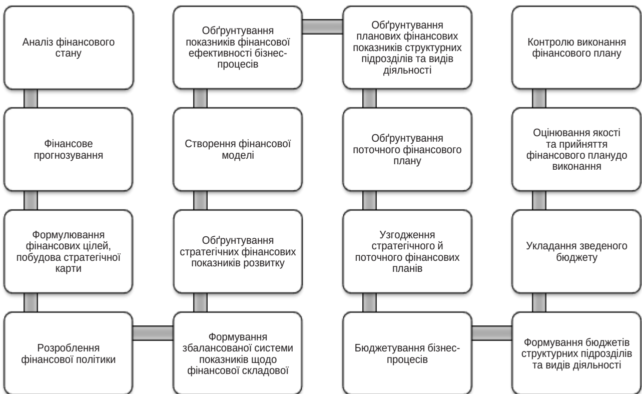
Рис. 1. Структурно-логічна послідовність фінансового планування

Фінансовий план завжди орієнтований на цілі, містить проміжні результати і відображає вид та обсяг фінансових ресурсів, використаних для досягнення цілей плану. Однак найголовнішим у фінансовому плані є кінцевий результат, який показує, чи правильно виконаний фінансовий план та які корек-