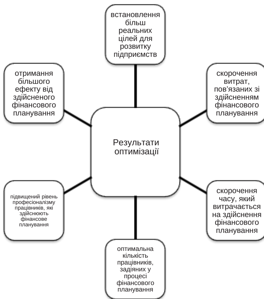
Рис. 3. Результати впровадження оптимізації фінансового планування на підприємствах