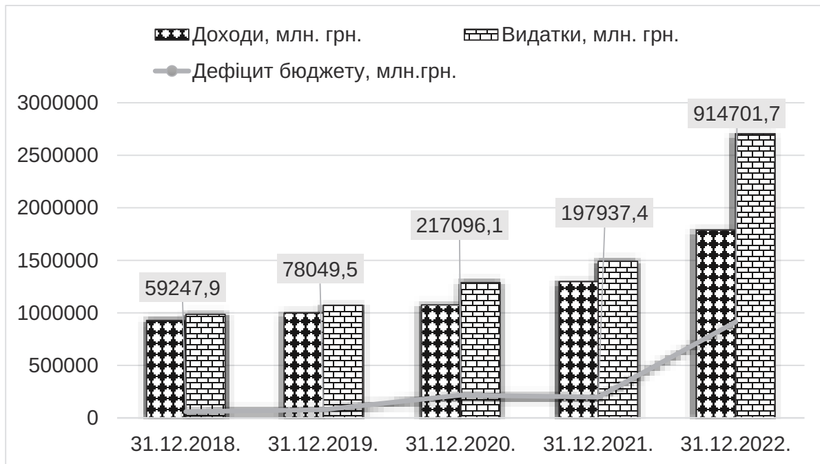
Рис. 2. Основні показники виконання Державного бюджету України у 2018–2022 рр., млн грн