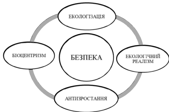
Рис. 3. Складові теоретичної моделі екологічно безпечного суспільного розвитку

Здійснений теоретичний аналіз дає підставу зробити висновок, що основні положення біоцентристів та поміркованих екоцентристів є найприйнятнішими за сучасних умов розвитку держави. Для таких позицій найприйнятнішою формою екологічного світогляду вважаємо екологічний реалізм, який передбачає формування екологічної свідомості людини на засадах поміркованих та комплексних заходів екологізації усіх сфер життєдіяльності, тобто екологізацію суспільного розвитку. Це, по суті, прояв основних положень концепції антизростання [19]. На