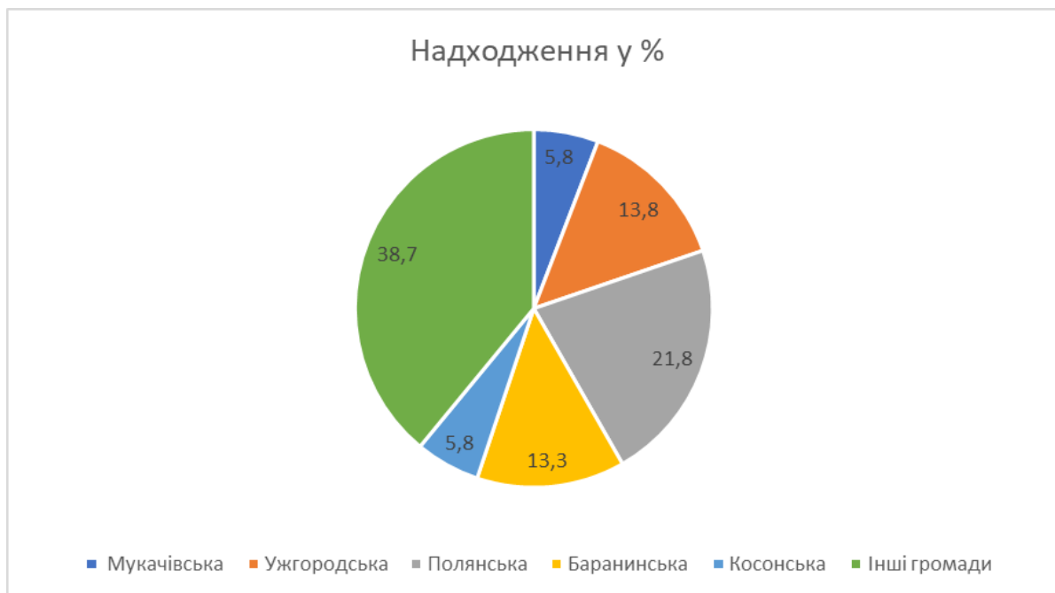
Рис. 2. Туристичний збір до бюджету Закарпатської області територіальними громадами, 2023 р.

Для зменшення впливу зазначених проблем на розвиток внутрішнього туризму необхідно: