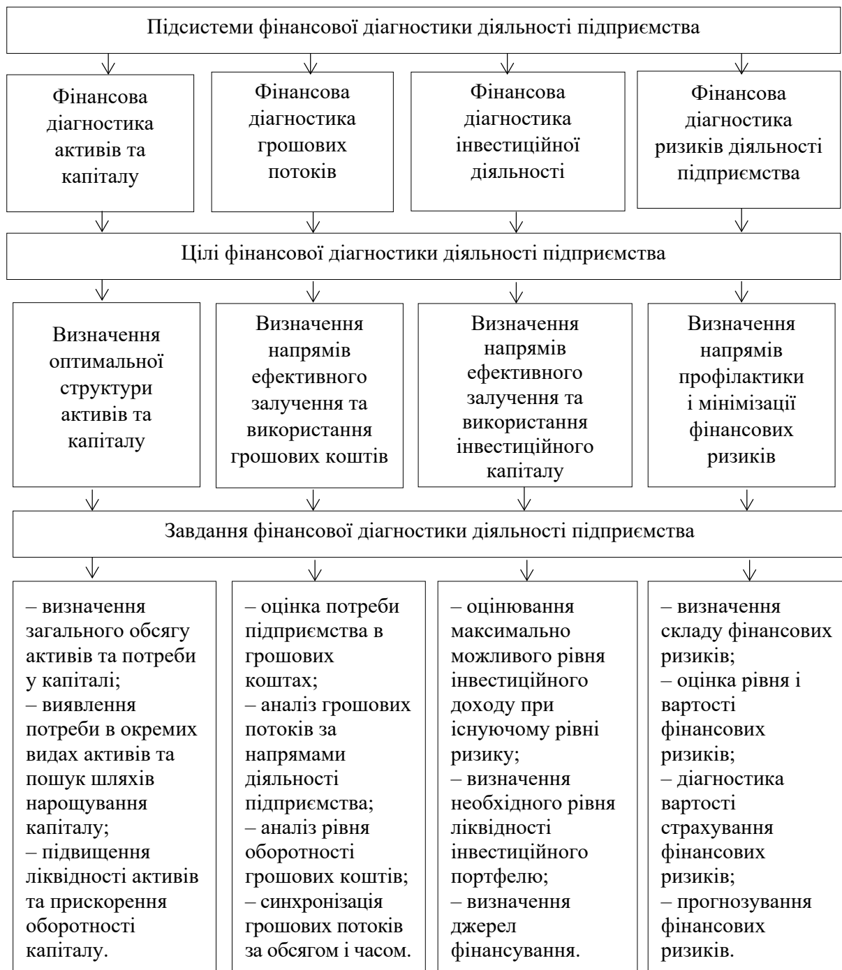
Рис. 1. Цілі і завдання системи фінансової діагностики діяльності підприємства