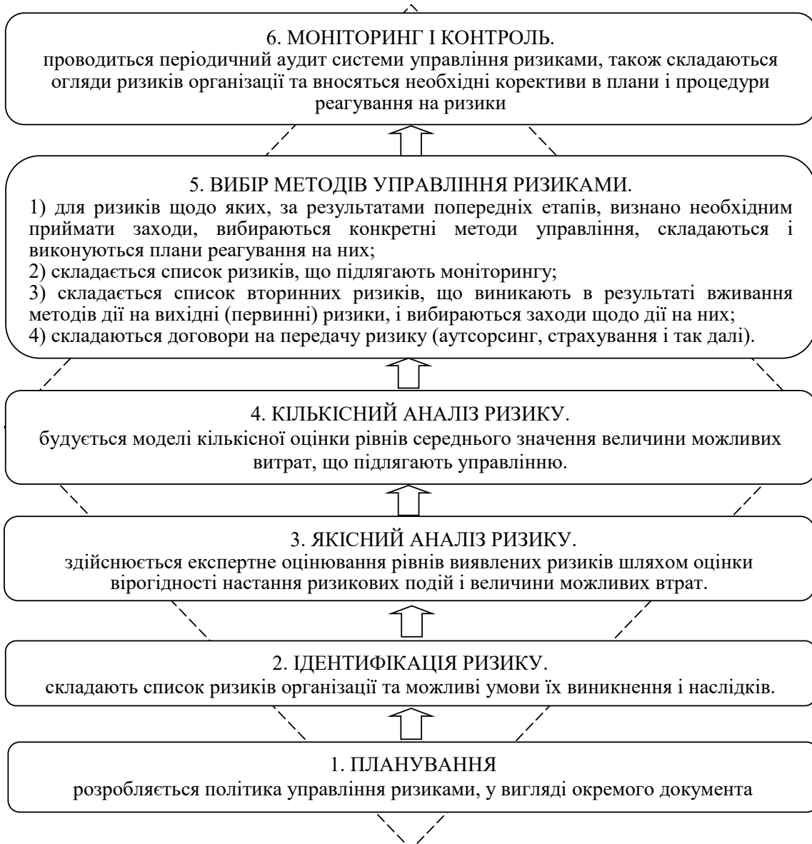
Рис. 3. Основні етапів процесу управління бізнес-ризиками