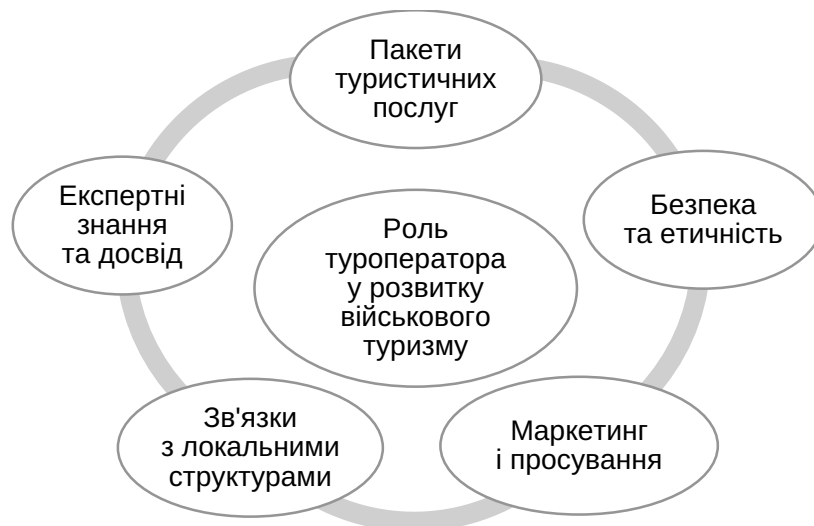
Рис. 1. Ролі туроператорів у розвитку військового туризму