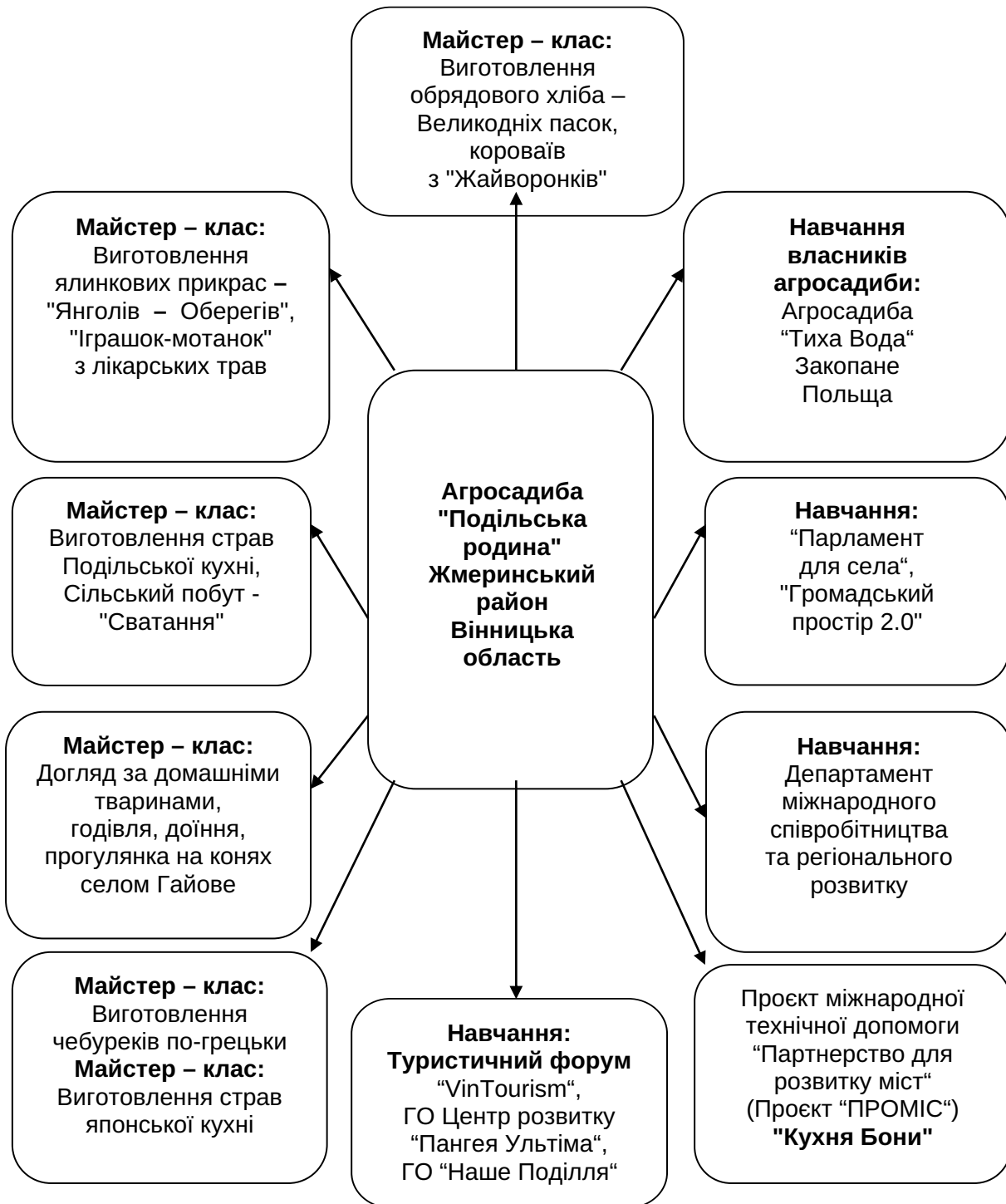
Рис. 2. Діяльність агросадиби «Подільська родина»

Діяльність агросадиби «Подільська родина» відображена на (рис. 2).