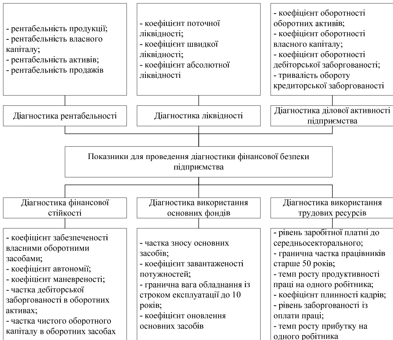
Рис. 2. Система показників для проведення діагностики фінансової безпеки підприємства