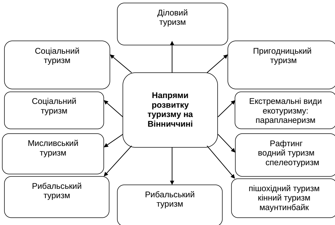
Рис. 2. Напрями розвитку туризму на Вінниччині [11]

15 липня 2021 року у Вінниці презентували проєкт «Camino Podolico: Подільський шлях святого Якова». Це дасть поштовх до створення в Україні першого повноцінного пішохідного маршруту за моделлю Шляху святого Якова (Camino de Santiago), який поєднає Вінницю та Кам'янець-Подільський історич-