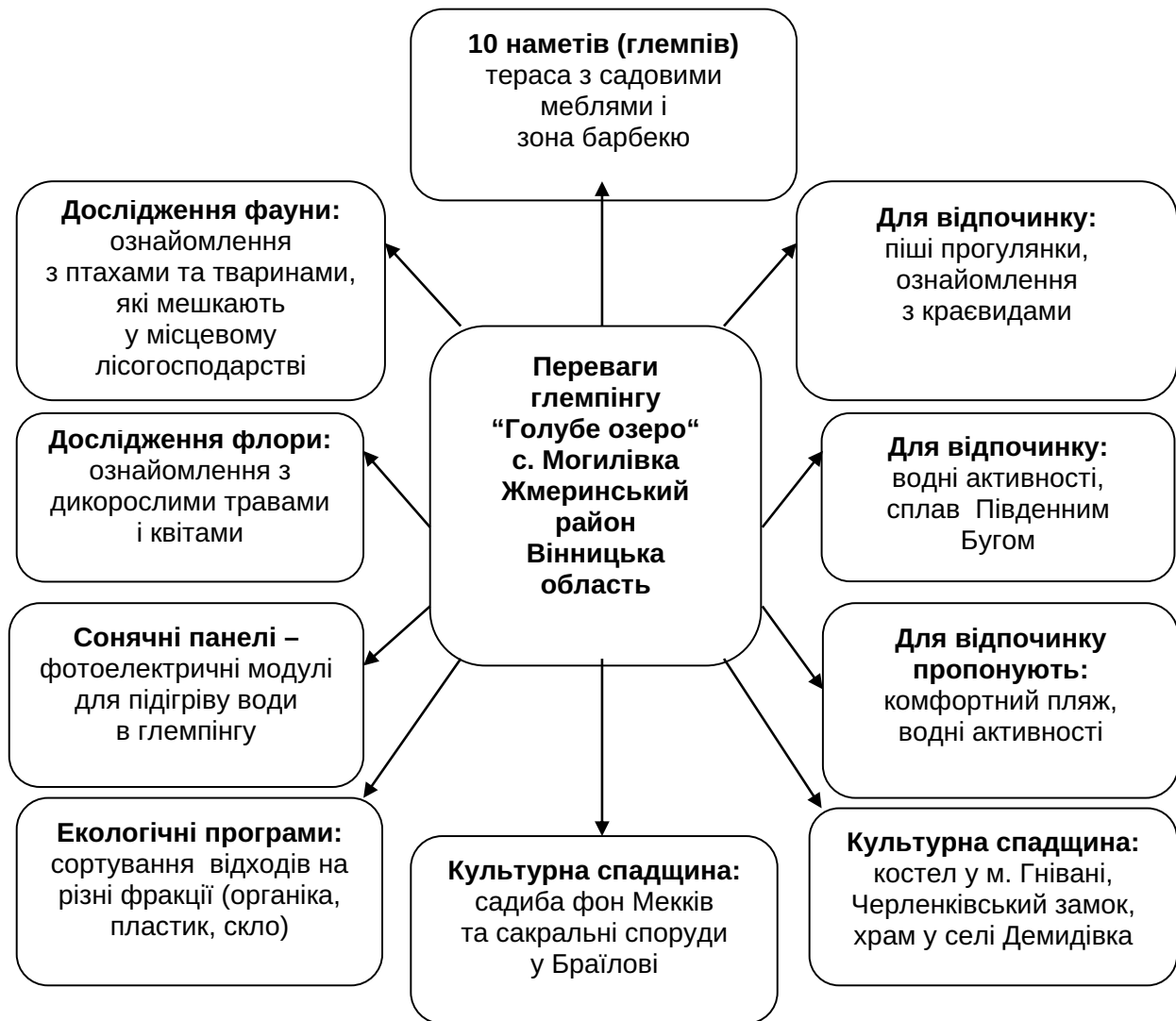
Рис. 4. Глемпінг «Голубе озеро» [13]

Висновки. У статті проаналізовано проблеми та перспективи розвитку туризму у воєнний час та механізми післявоєнного відновлення галузі, а також туристичні атракції, традицій, звичаї Поділля, які відроджують у межах ефективного розвитку екологічного туризму в регіоні.