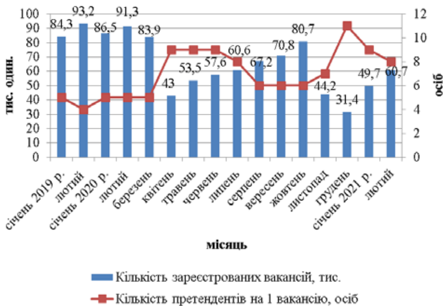
Рис. 2. Динаміка кількості зареєстрованих вакансій та кількості претендентів на 1 вакансію

Аналіз масового вивільнення працівників в регіональному розрізі [2] у січні-лютому 2021 року в порівнянні з аналогічним періодом 2020 року свідчить, що збільшення вивільнення працівників спостерігається в Вінницькому регіоні (більше 6,5 тис. осіб), Полтавському, Львівському, Кіровоградському, Дніпропетровському регіонах (на рівні 3,0-3,6 тис. осіб), Луганському, Рівненському, Тернопільському регіонах (більше 2,8 тис. осіб), Миколаївському, Донецькому, Одеському регіонах (на рівні 1,7-2,1 тис. осіб), Волинському та Хмельниць-