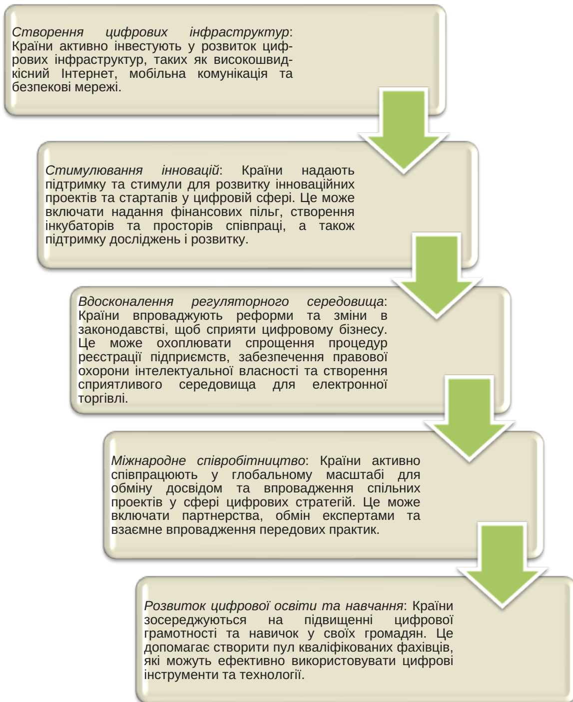
Рис. 2. Заходи, що сприяють розвитку цифрових стратегій на рівні країн