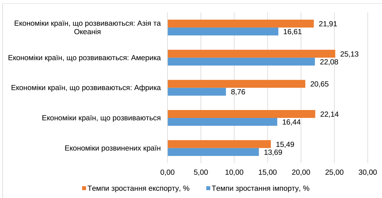
Рис. 2. Річні темпи приросту експорту послуг за групами країн, 2021 р.