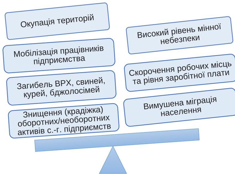
Рис. 2. Фактори, які спричиняють дестабілізацію функціонування ринку праці в аграрному секторі економіки