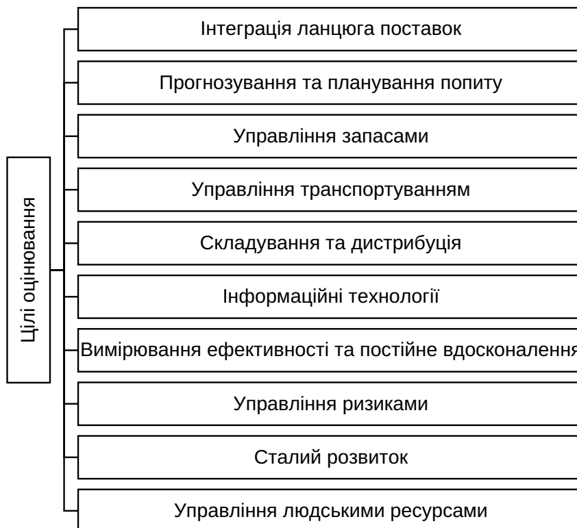
Рис. 2. Основні цілі оцінювання ефективності та якості управління логістичним потенціалом

Витрати на складування. Загальні витрати, пов'язані зі зберіганням, обробкою та управ-