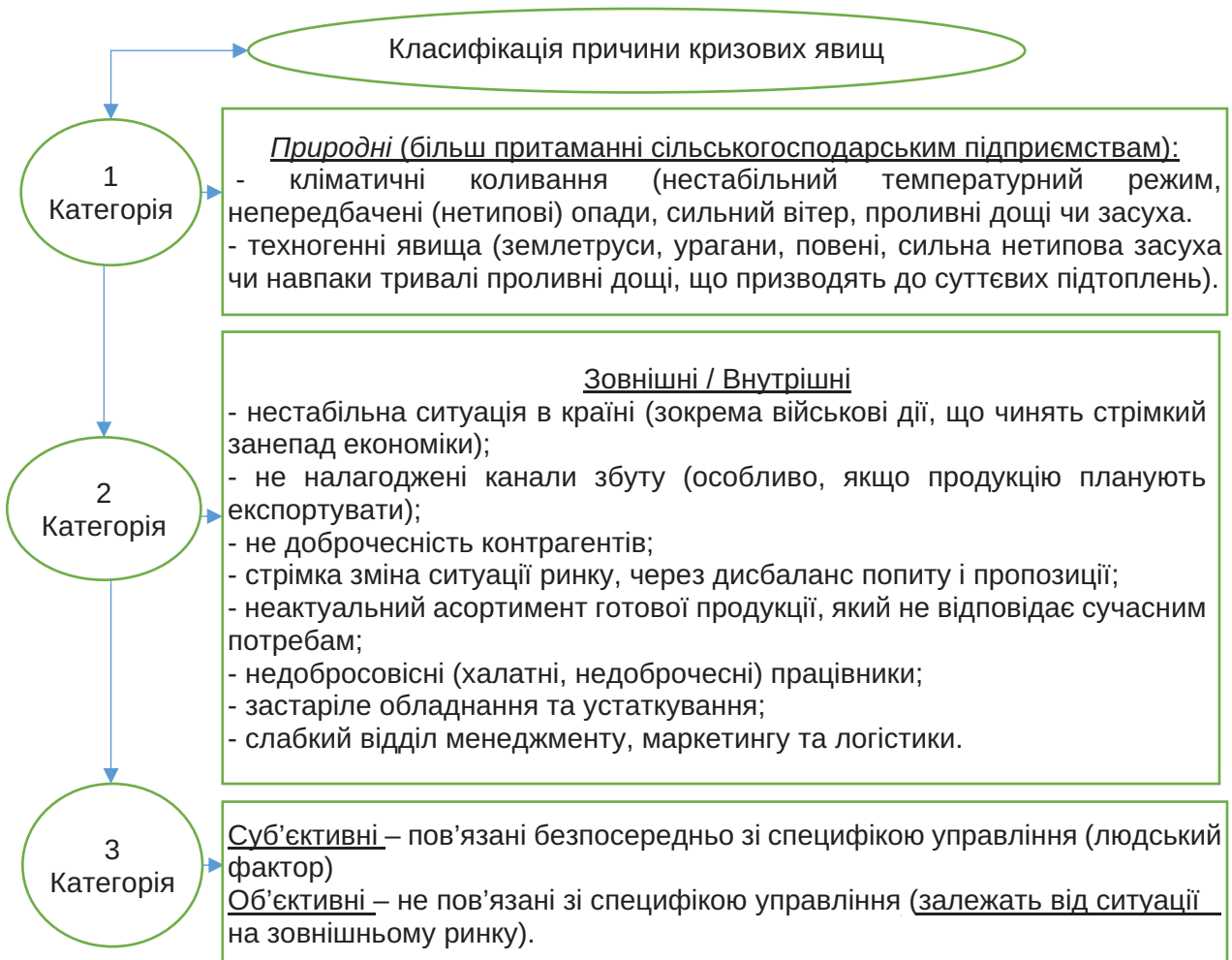
Рис. 1. Класифікація кризових явищ

Вважаємо, що антикризове управління стало невід'ємною складовою ведення вітчизняного бізнесу. Даний фактор спричинений доволі нестабільною економічною ситуацією, досить низькою інвестиційною привабли-