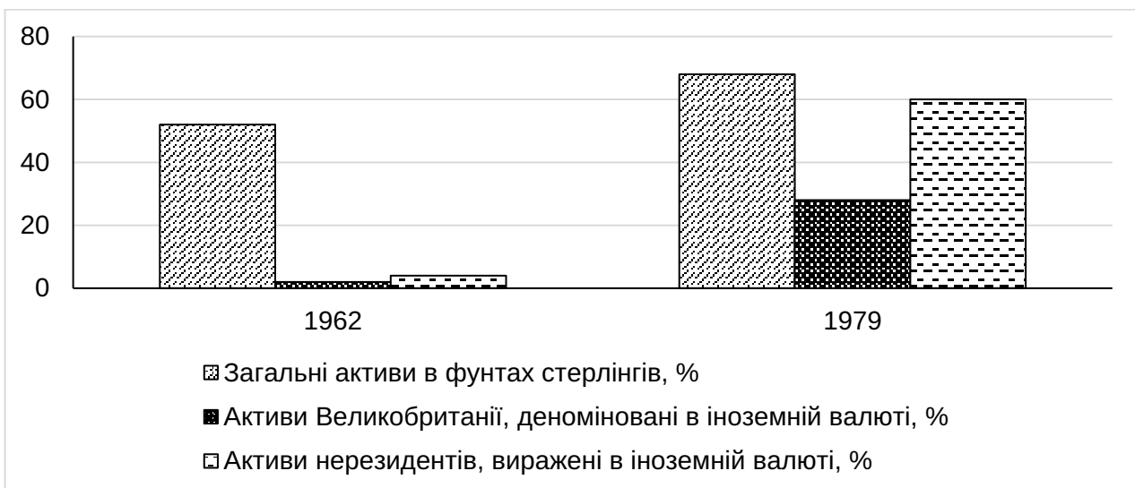
Рис. 2. Відношення активів фінансових установ Великобританії до ВВП у 1962 та 1979 роках