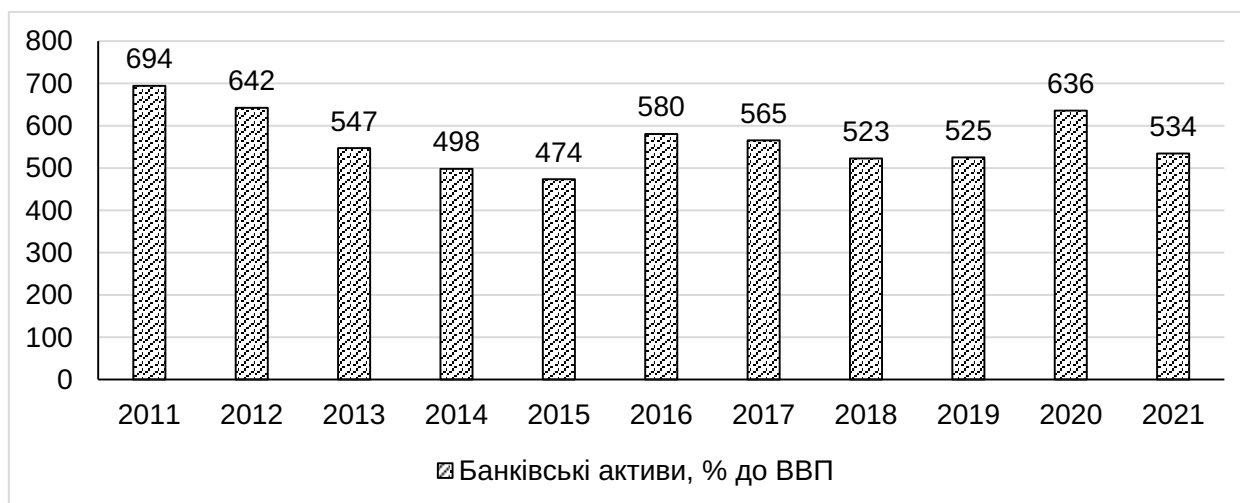
Рис. 4. Відношення активів банківської системи Великобританії до ВВП у 1911–2021 роках