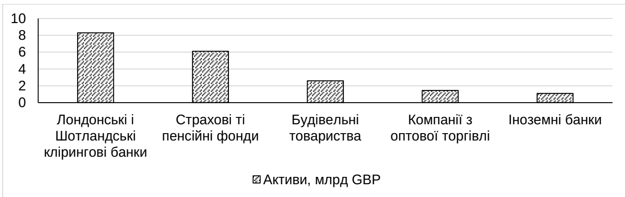
Рис. 1. Обсяги активів фінансового сектору Великобританії у 1958 році

У 1960-х і 1970-х роках іноземні банки почали розширювати свою діяльність у Сполученому Королівстві, що сприяло перетво-