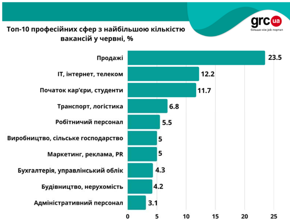
Рис. 1. Топ-10 професійних сфер з найбільшою кількістю вакансій у червні, % Джерело: [9]