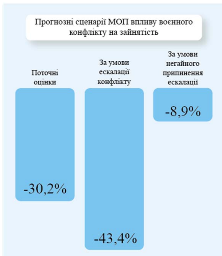
Рис. 3. Прогнозні сценарії МОП впливу воєнного конфлікту на зайнятість

Незалежно від тривалості війни потрібно вже думати про майбутнє та формувати про-