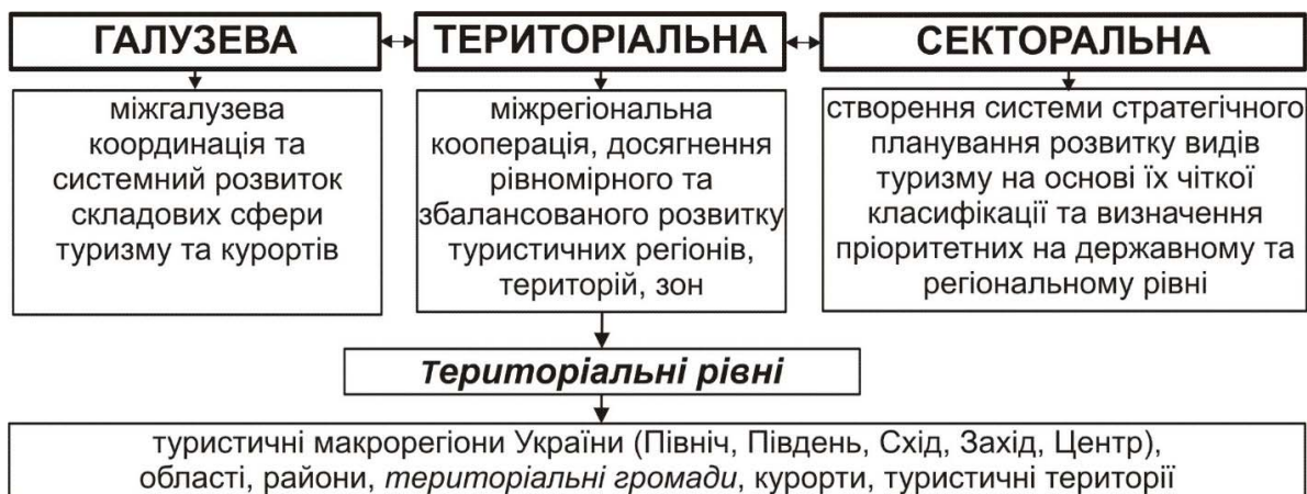
Рис. 1. Складові державної політики у сфері туризму та курортів України