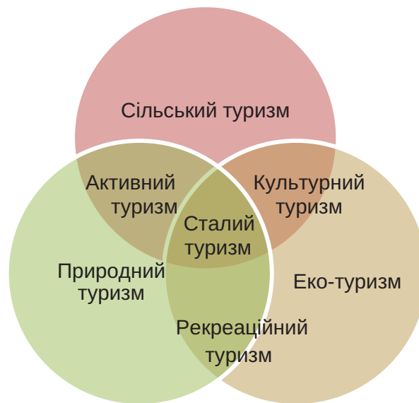
Рис. 3. Екологічні сегменти у сталому туризмі